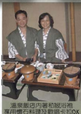
溫泉飯店內著和服浴袍 享用懷石料理及歡唱卡拉OK