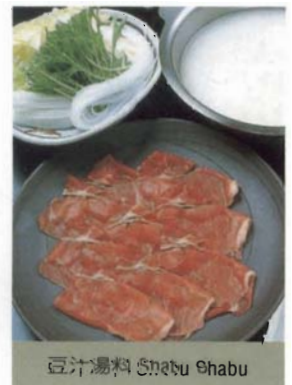
豆汁湯料 Shabu Shabu