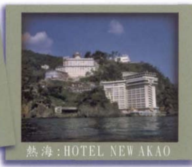
熱海:HOTEL NEW AKAO