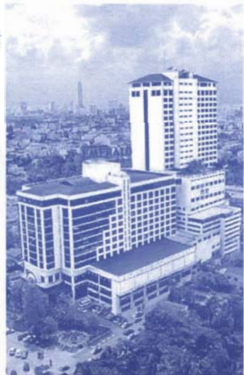
曼谷：EMERALD HOTEL (新館：DELUXE ROOM)