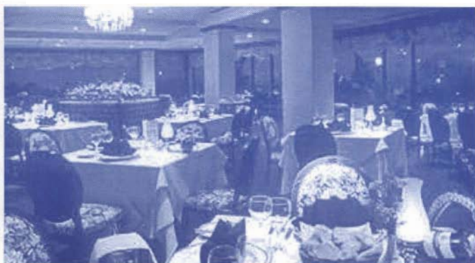
酒店內豐盛的泰、中、西式自助早餐