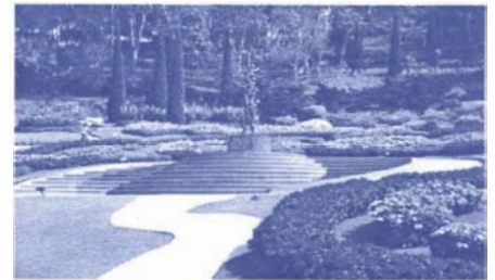
瑞士花園之稱的皇太后花園