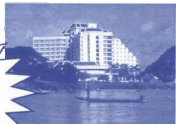
芭達雅：DUSIT RESORT HOTEL