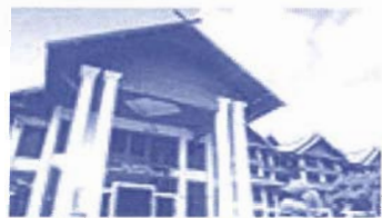
金三角：IMPERIAL GOLDEN TRIANGLE RESORT